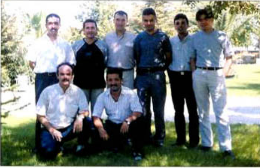
Er-Bakır sosyal faaliyet ekibinin bir bölümü..