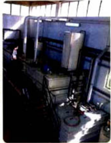
"Atık Su Arıtma Tesisimiz"

Atık Su Arıtma Tesisimiz 16 Kasım 1992 tarihinde çalışmaya başlamıştır. Tesisimiz Alman Goema Firması tarafından yapılmış olup, günde 40 m 3 atık suyu işleme kapasitesine sahiptir. Atık Su Arıtma Tesisimizde 2 kişi çalışmaktadır.