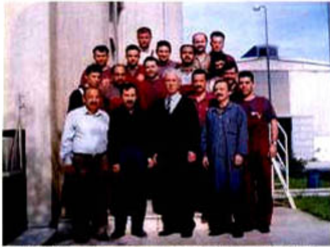
"ER-BAKIR'in bütün arızalarını yok eden arkadaşlarımızın bir bölümü."

Bakım bölümü, ER-BAKIR'daki makine ve ekipmanların daha uzun ömürlü ve verimli bir şekilde çalışmasını sağlamak amacıyla tamir, bakım ve iyileştirme faaliyetleri konusunda hizmet vermektedir.