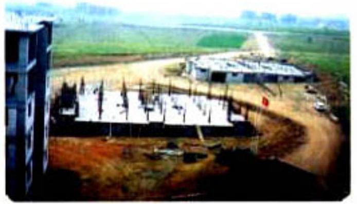
"Temeli atılan son 2 bloğumuzun görüntüsü"

İnşaatlar bittiğinde 120 çalışmamız, iş arkadaşlığının yanında depreme karşı daha güvenli yapılan bu evlerde komşuluk ilişkilerinin de ekleyerek mutlu bir yaşam sürecekler.