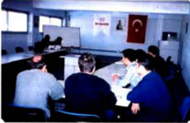
"Çalışanlarımız odiyometrik test için sırada beklerken"

15-16 Mart tarihleri arasında şirketimizde odiyometrik test ve röntgen taraması yapıldı. Çalışanlarımızın kulak ve akciğer sağlığı ile ilgili yapılan bu testlerin sonuçları Mayıs ayı içinde elimize ulaştı. Şirketimizde ilk defa uygulanan odiyometri testi ile çalışanlarımızın kulaklarındaki duyma seviyeleri tespit edilip, bu olumsuzlukları gidermek için önlem alabileceğiz.