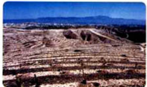
"DOÇEV 2001 Trafik Yılı Anı Ormanı 5 yıl sonra yemyeşil olacak!"

Yaşanabilir bir dünyayı paylaşmak dileğiyle.