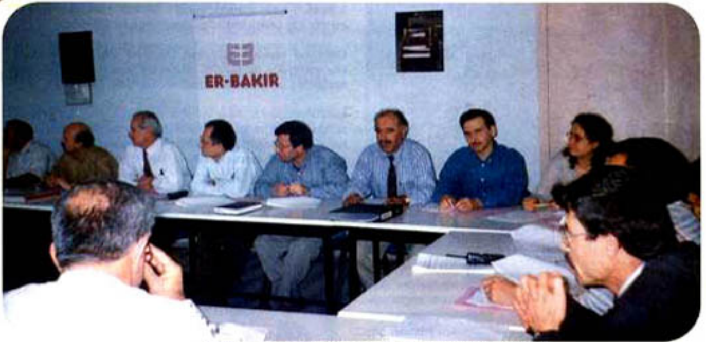
"Eğitime inanan Er-Bakır'lıları bir eğitim anından anımsatane"

Er-Bakır, Denizli'deki üretim ve ciro anlamındaki liderliğinin yanı sıra, çeşitli kuruluşlara yaptığı yardımlar, kültürel ve sosyal faaliyetlerin desteklenmesi, sempozyumlar ve toplantılarda yöneticilerimizin yaptığı konuşmalar gibi toplumsal sorumlulukların bir çoğunu yenne getirmektedir. Tüm bu çalışmalar toplumda kaliteli bir yaşam biçimi oluşturmak içindir. İşte bu kaliteli yaşam biçimi oluşturmanın en etkili aracı eğitimidir.