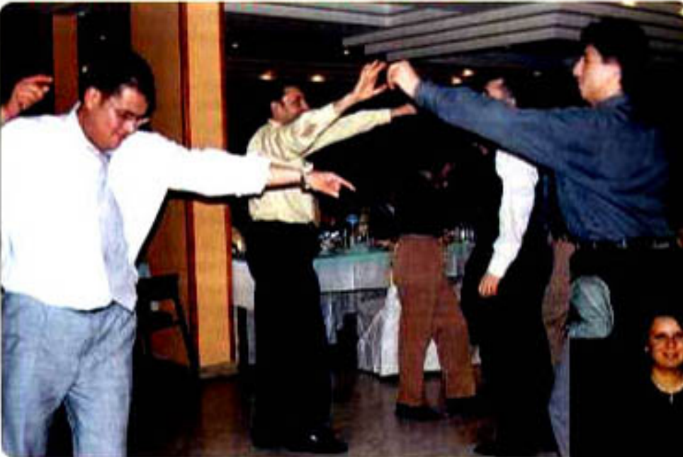
"ER-BAKIR gecesinde hep beraber eğlendik"

10 Şubat 2000 Cumartesi gecesi Pamukkale Pamuksu Otel'de buluşan Er-Bakır çalışanları gönüllerince eğlendiler. Bu eğlence sırasında Özer beyin şırları ve Türk sanat müziği şarkılarıyla coştuk. Bir sonraki yemekte tekrar buluşmak üzere.