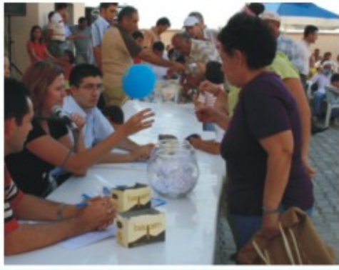
Oya Eşer yerine annesi ve kızı